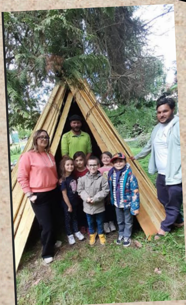
Matériel fourni gratuitement par l'entreprise Jourda Charpente à Beauzac