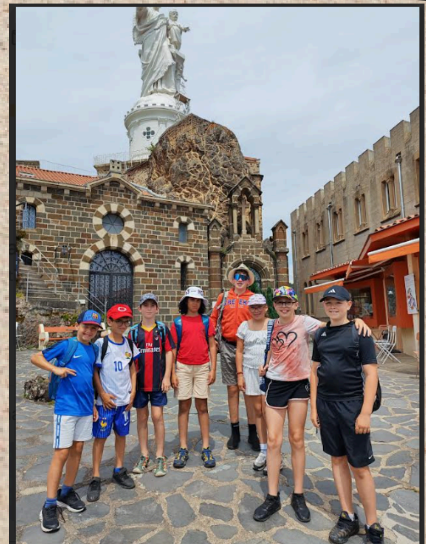
Les communiantes de cette année lors d'une journée à Espaly au sanctuaire Saint Joseph